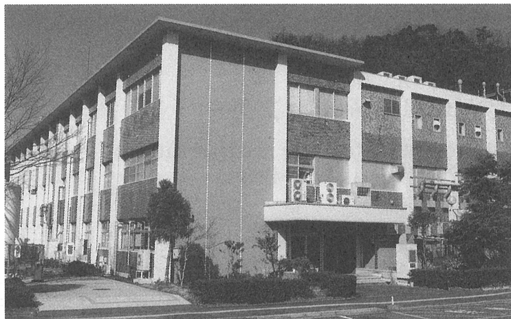
写真1 固体地球研究センター本館（1998パンフレットから）