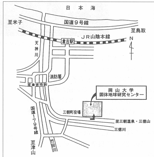
図1 固体地球研究センターの位置 〒682-0193 鳥取県東伯郡三朝町山田827 Tel: (0858) 43-1215. Fax: (0858) 43-2184

敷地は48,013m 2 で、医学部附属病院三朝分院と共用である。本館研究棟(RC-3、写真1)は延面積2,738m 2 、第二研究棟(RC-5)が1,700m 2 であり、そのほか、年代測定機器棟(RC-2)、超高压実験室(RC-1)、鉱物資料庫、石工室などがところ狭しと立ち並んでいる。また、宿泊施設も完備