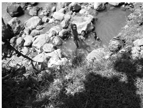
写真 3 子供たちが入浴していた石積みの浴槽