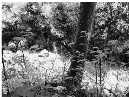
写真 1 断層路頭（この断層の延長の先に、炭酸の噴出を伴う温泉が見られる：写真2）