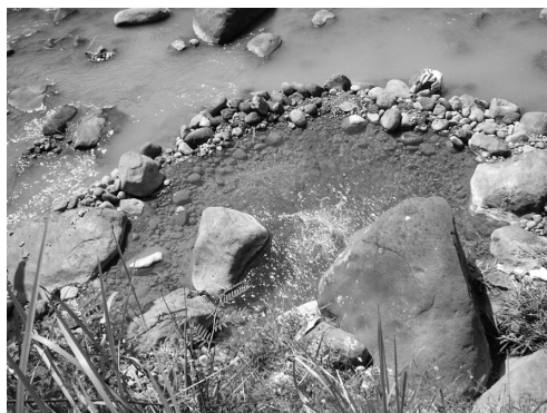
写真 2 炭酸の噴出の見られる石積みの浴槽