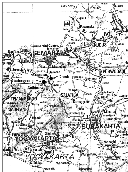
Fig. 1 Location of hot-springs in Diwak and Derekan, and steam in Gedongsongo, Central Java.

る。 デウィワック村とデラカン村の境に流れる川の, 川沿いに炭酸を多く含んだ温泉が三箇所に湧出している (Fig. 2). 周辺の地形は河岸段丘でその地質は土石流か集塊岩で成り立っている. それを切って活断層の露頭が見られる (写真 1). これらの断層は若い断層沿いに見られ, 泉温はどれも 37°C 程度で非常に多くの遊離炭酸ガスを含んでいる. 泉源 DW-1 に石を積み上げて露天の浴槽を作っている. 昼の最中であつたが, 村の男性が入っていた. その入浴客に聞くと, 非常に疲れが取