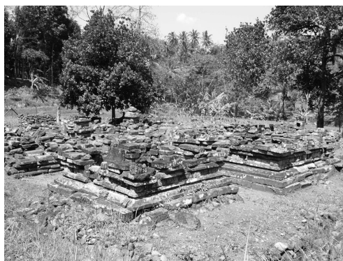
写真 4 河岸段丘にみられるヒンズー遺跡

山から東に 15 km 強離れていて、断層沿いに出ているので、構造性の温泉で火山性のものでないと説明した。しかし、われわれは日本の温泉分布からみて噴火口からの距離が 15 km 程度までは火山性の温泉と考えているので（核燃料サイクル機構，1999），重曹泉の成分は断層に関するものとしても、塩化物・硫酸塩泉の成分は火山性の成分であると見ている。この温泉の近くの河岸段丘上にヒンズーの遺跡が見られる（写真 4）。中部ジャワの火山地帯の火口の中や湧水・湧泉には、ヒンズー寺院の遺跡が多く見られ、神聖な場所と見られる。