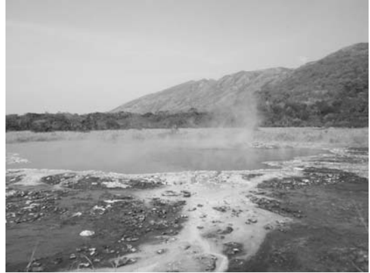
Photo 2 Bitende Hot Spring with the Rwenzori Mountains in the background.

キタガタ温泉 (Photo 4) は、西地溝帯底辺のエドワード湖から直線距離で 60 km ほど南東にある。エドワード湖の約 10 km 北東には、キタガタ温泉とは別にキタガタ火口湖があるが、ウガンダの人々に聞くと「キタガタ