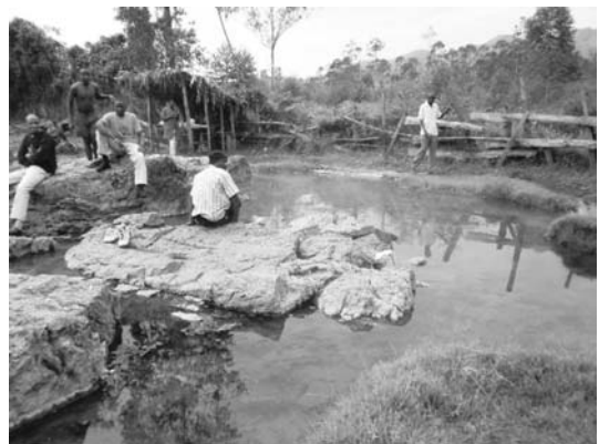
Photo 4 Source of Kitagata Hot Spring.