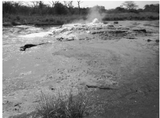
Photo 3 Nyasimbi Hot Spring and surrounding swamp.