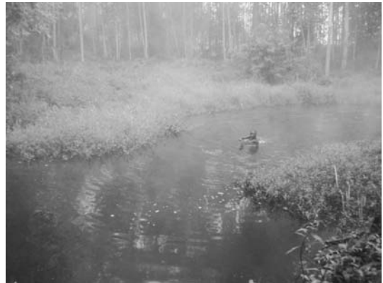
Photo 6 Echejongo Hot Spring and surrounding swamp.

エチェジョンゴ温泉 9) は、エドワード湖から直線距離で 100 km ほど南南東にある。ウガンダ南西部の町カバレから、ルワンダ国境へ向かう舗装路を 7 km ほど走った道路沿いに位置しているが、温泉を示す看板や標識はない。温泉の周囲は湿地で樹木に覆われている (Photo 6)。源泉は泥中から自然湧出しており、泥中計測温度 27°C、水温 25°C、pH 7.0 であった。地元民によると、季節や年によって温泉の温度は変わるらしい。腰痛や関節痛に効くといわれ、休日には地元民が入浴に来るということである。