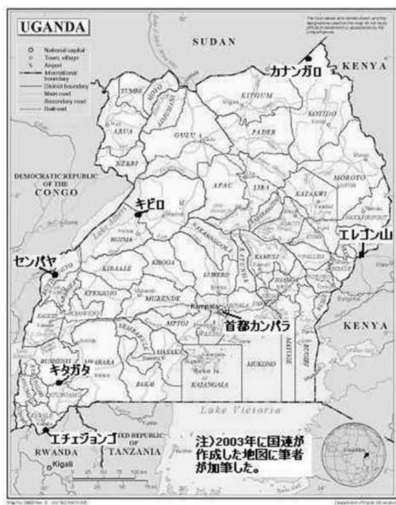
Fig. 1 Map of Republic of Uganda (Noticed hot springs in letters).

ウガンダの温泉は西部に多いが、東部と北部にも温泉がある (Fig. 1)。首都であるカンバラはビクトリア湖の北岸に位置しており、標高約 1,300 m の丘陵地で