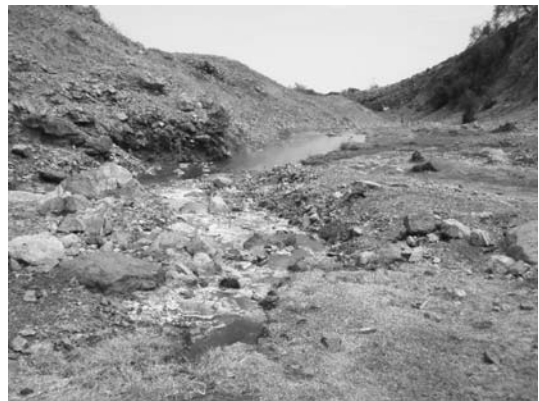
Photo 1 Kibiro Hot Spring and its stream.