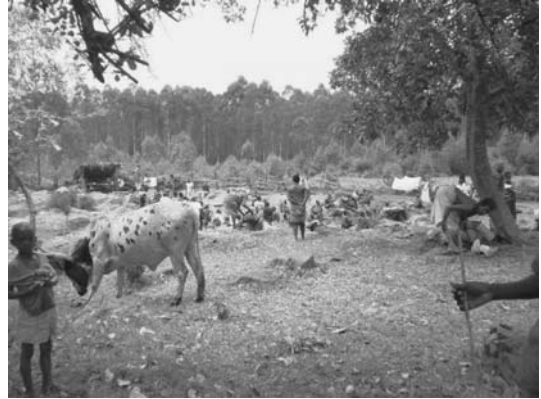
Photo 5 People relaxing at Kitagata Hot Spring.

たとえば、エドワード湖南東のキタガタ温泉」であるという。キタガタとは、部族語で「熱い水」を意味する。キタガタ温泉の源泉は自然湧出で公称 90°C だが、筆者の測定によると源泉 62°C、pH 7.5 であった。源泉と入浴泉は高低差を用いて、逆流しないような構造になっている。入浴泉は 34°C で、来訪時には 40 人以上の人々が裸体で入浴しており、周りにも多くの療養客が寛いでいた (Photo 5)。この温泉は外傷や関節炎などに効能があるとされ、入浴は午前中が良いとされている。キタガタ温泉の療養効果はウガンダでは有名であるため、首都カンパラから「キタガタ温泉ツアー」もあるらしい。